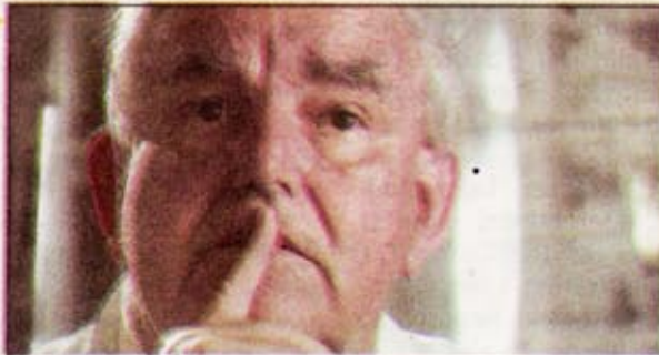
"Seva Vive" uses letters, old film footage, above, and interviews with prominent living historians such as Fernando Picó, left.